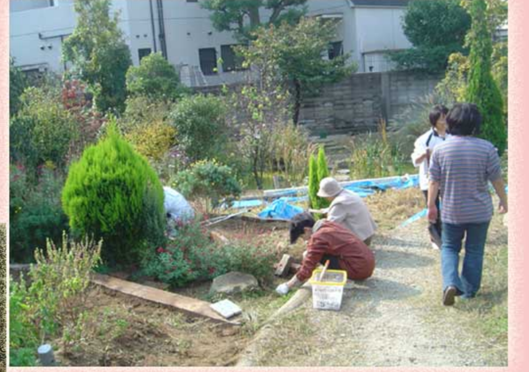
花壇用枠のニスぬり