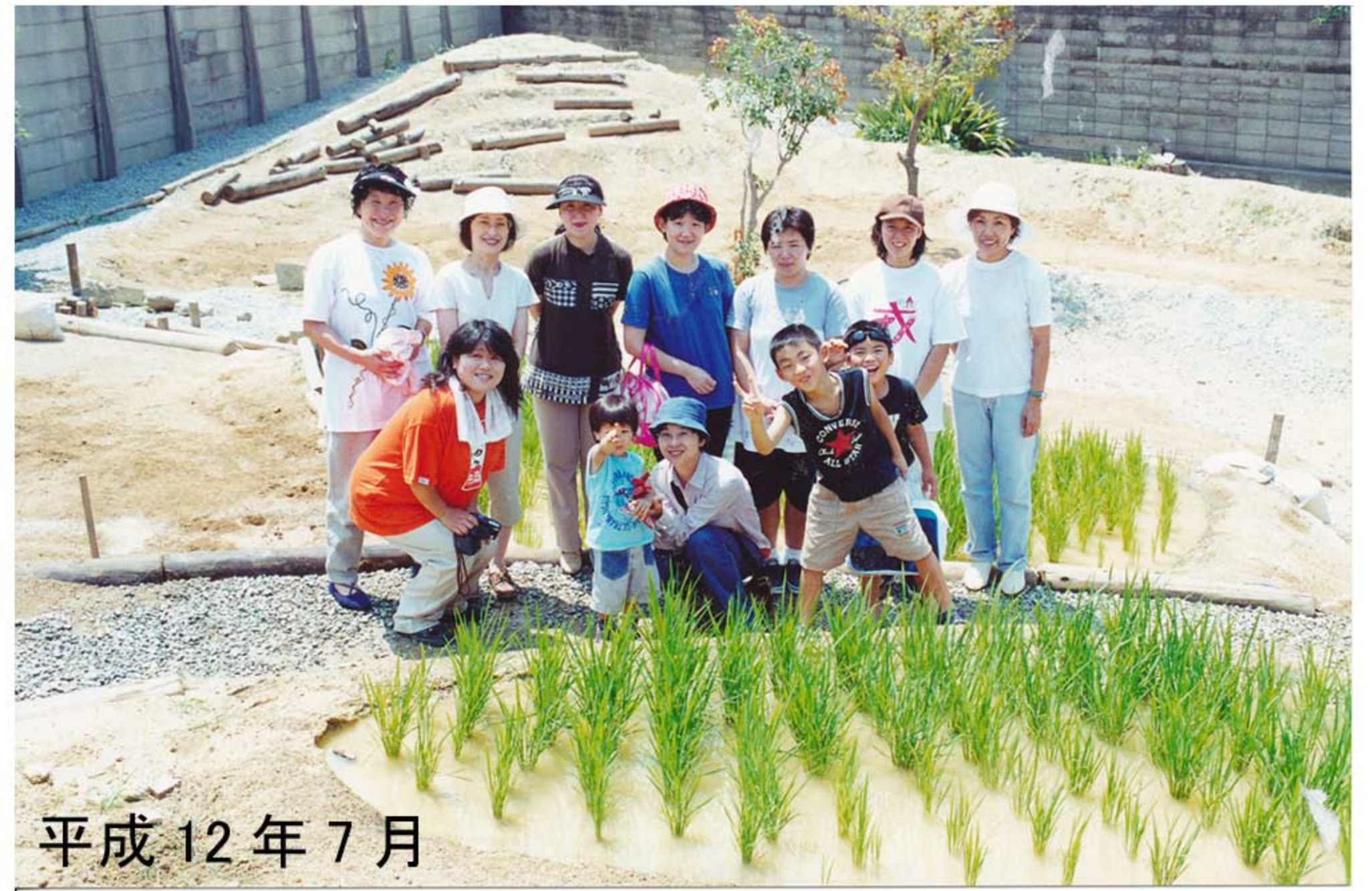
平成 12 年 7 月