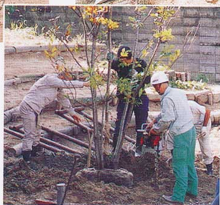
高橋園芸のみなさんもボランティアの一員のように植栽のあとの作業に参加していただきました。