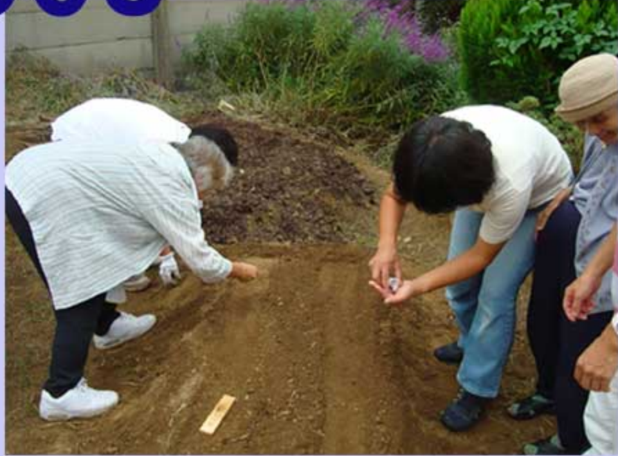
天王寺かぶらはじめての種まき