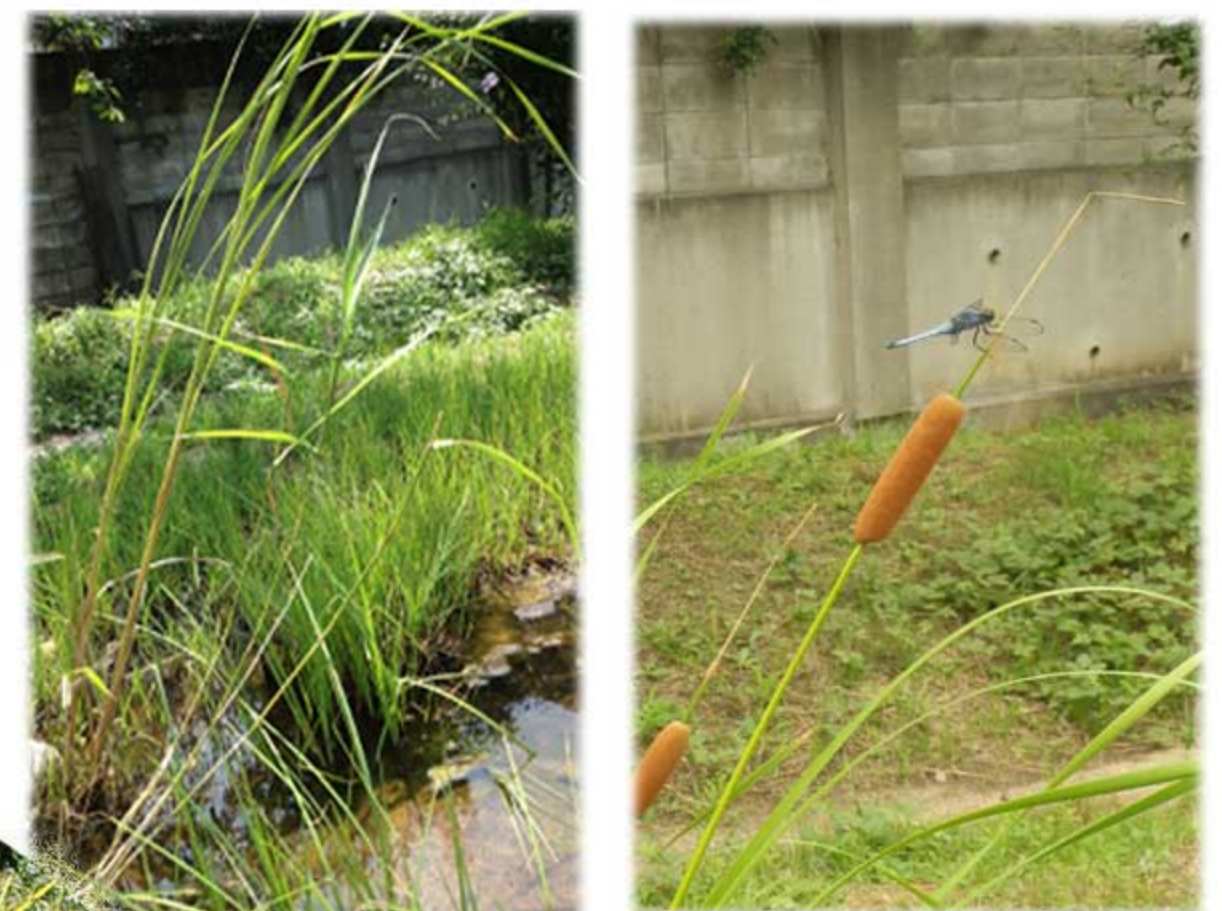
片葉の葦 蒲 米づくり (イセヒカリ)