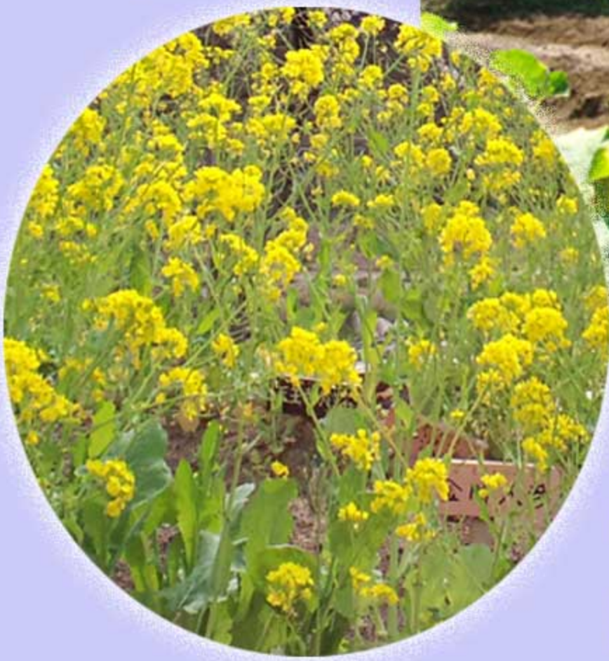
天王寺かぶらの花