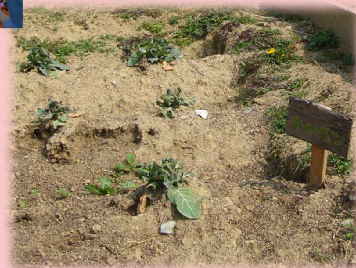
あおむしからちょうちょうへ 3年生 キャベツ畑 蝶の完全変態の観察