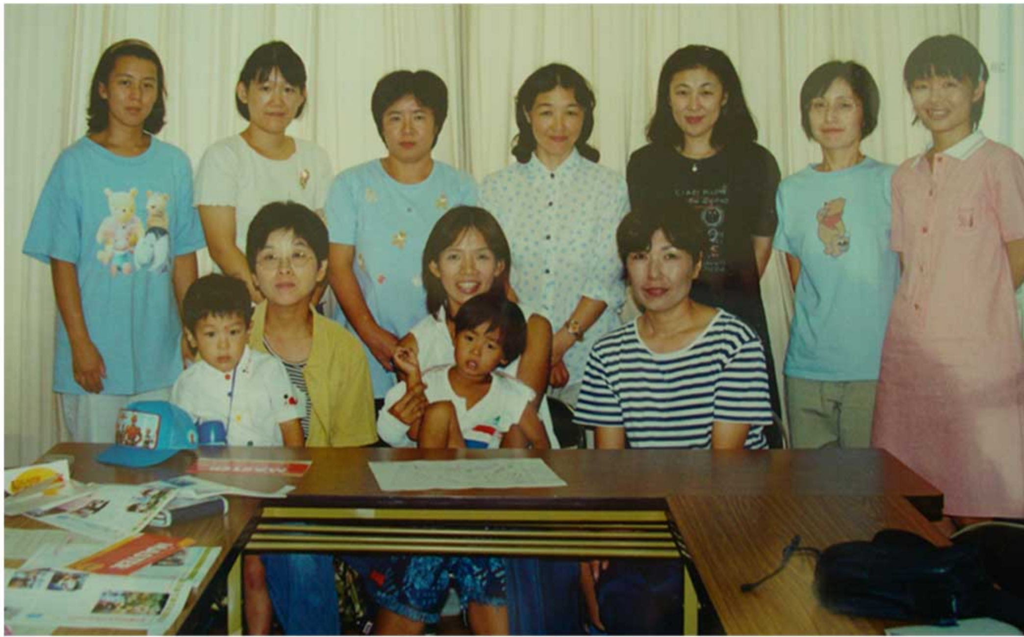
平成 12 年 7 月 17 日「園芸クラブ」発足 第 1 回定例会